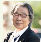
三井所 清典 日本建築士会連合会 名誉会長