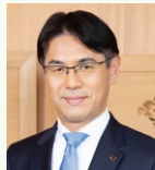
山下 眞 奈良県知事

奈良教育大学でESDを学ぶ詩吟日本一の学生と仏像の美に魅せられた学生が有形と無形の文化遺産の融合から生まれ・見えてくる奈良の魅力、その観光資源としての価値について知事と語り合う。かつてフェノロサが語った「奈良は東洋のローマである」という言葉の意味が浮かび上がる。