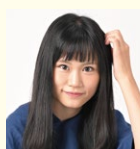
逢香 妖怪書家・書家