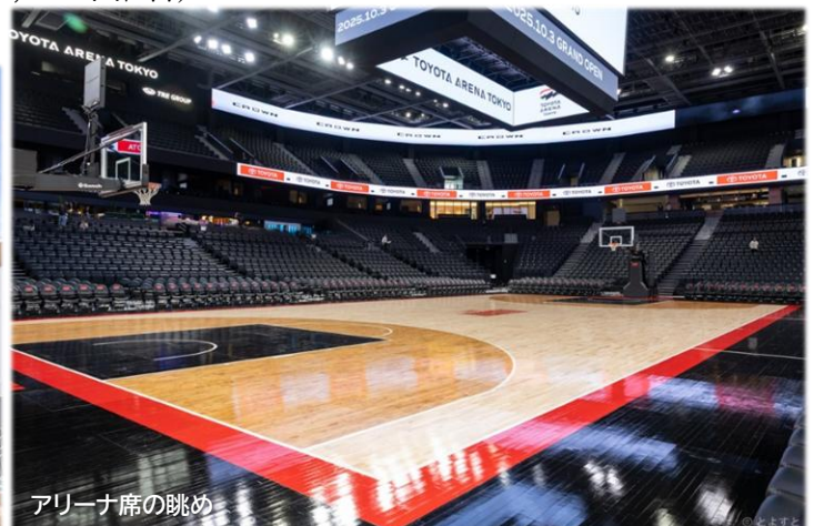
アリーナ席の眺め