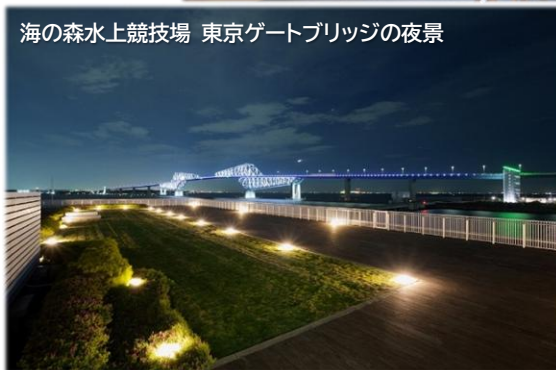
海の森水上競技場 東京ゲートブリッジの夜景