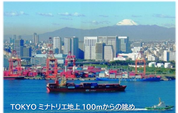
TOKYO ミナトリエ地上 100mからの眺め