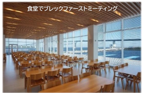
食堂でブレイクファーストミーティング

都営バス移動 海の森公園 10:39-10:55 東京テレポート駅前 (都営バス波 01))