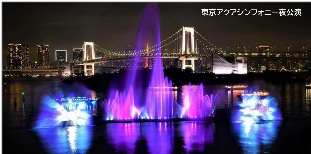
東京アクアシンフォニー夜公演

東京アクアシンフォニー見学(20:00 の回) (カノン 東京都交響楽団 指揮/小泉和裕)