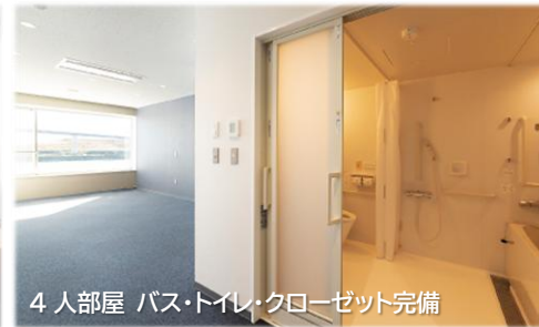
4 人部屋 バス・トイレ・クローゼット完備