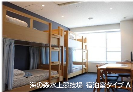
海の森水上競技場 宿泊室タイプ A