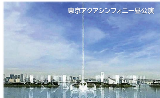
東京アクアシンフォニー昼公演