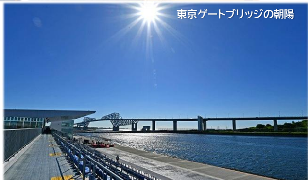
東京ゲートブリッジの朝陽