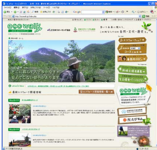
エコウォーク公式サイト